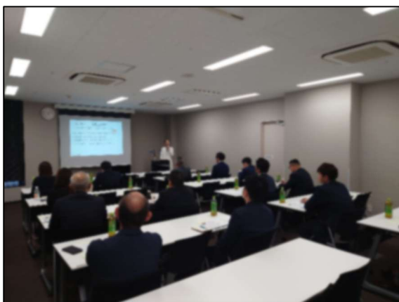
座学の研修会（管理者向け）