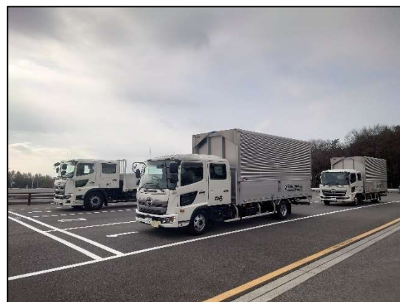
安全運転研修会（運転者向け）