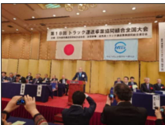
日貨協連「全国大会」