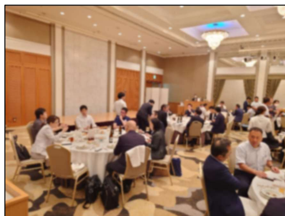
他協同組合の研修交流会